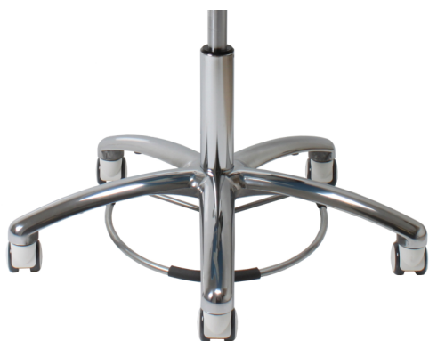
Stolen kan erhållas med fotkontroll.